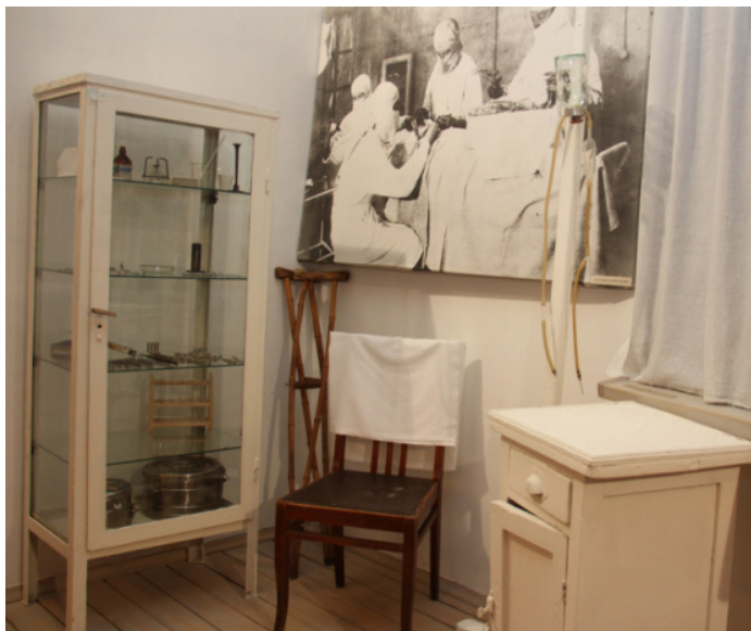
Рисунок 4. Военный госпиталь