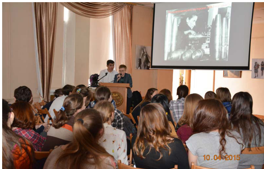
Рисунок 3. Занятие, посвященное жизни Загорска в военные годы

Так из запроса восьмиклассников и был создан данный проект. В ходе его реализации обучающиеся не только сами узнали о жизни города и труде загорчан в годы войны, но и познакомили остальных гимназистов с ней в форме викторины, приуроченной ко Дню Победы, собрали материалы для изучения истории края, которые стали частью школьного курса (рис. 3).