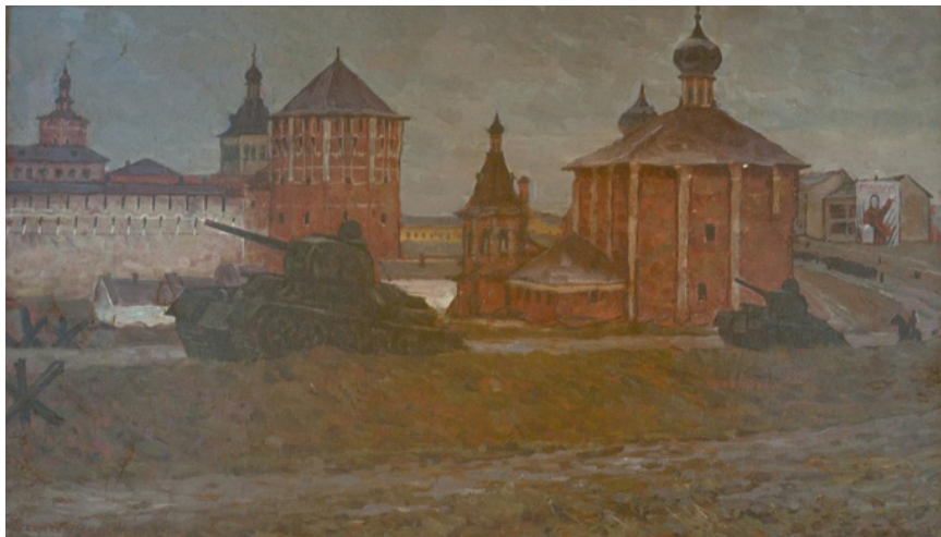
Рисунок 2. Н. И. Барченков «Загорск в ноябре 1941 г.»

Так из запроса восьмиклассников и был создан данный проект. В ходе его реализации обучающиеся не только сами узнали о жизни города и труде загорчан в годы войны, но и познакомили остальных гимназистов с ней в форме викторины, приуроченной ко Дню Победы, собрали материалы для изучения истории края, которые стали частью школьного курса (рис. 3).