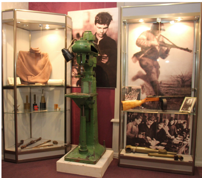
Рисунок 5. Пистолет-пулемет Шпагина (Краеведческий отдел Сергиево-Посадского государственного историко-художественного музея-заповедника)