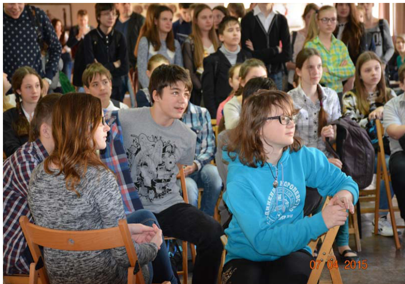
Рисунок 8. Перед игрой

Для успешного проведения викторины необходимо четко проработать организационные моменты, возможно, проанализировать опыт работы других групп: определить рассадку зала, подготовить технические средства, выбрать ведущего и жюри игры, рассмотреть способ подсчета результатов и награждения победителей. Мини-проекты групп завершаются анализом своей работы (рис. 9).