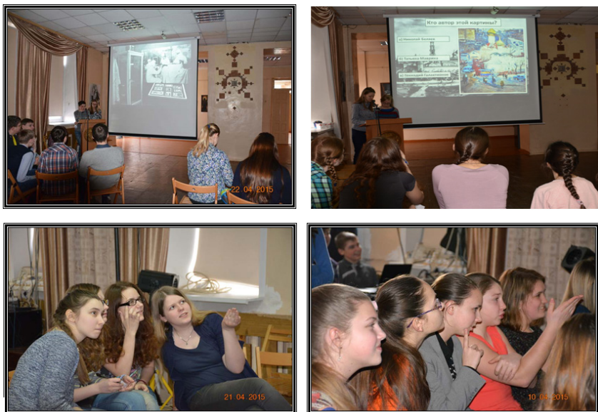
Рисунок 9. Проведение викторины