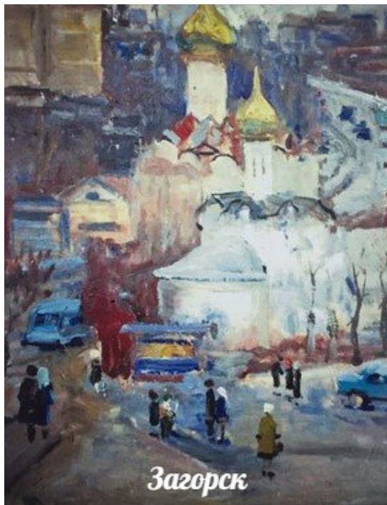
Рисунок 2. Картина «Загорск»

5. Кому из сергиевопосадских поэтов принадлежит данное стихотворение?