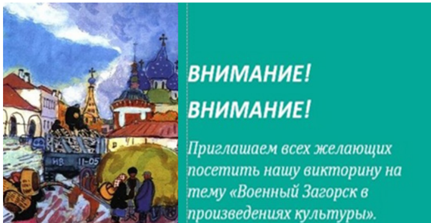
Рисунок 6. Анонс викторины