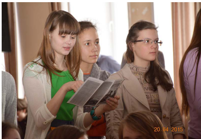
Рисунок 7. Подготовка к викторине

Если викторина проводилась в форме командной игры, а не индивидуального участия, то группы можно было сформировать предварительно с использованием интернет-ресурсов или предложить обучающимся занять заранее подготовленные места перед игрой (рис. 8).