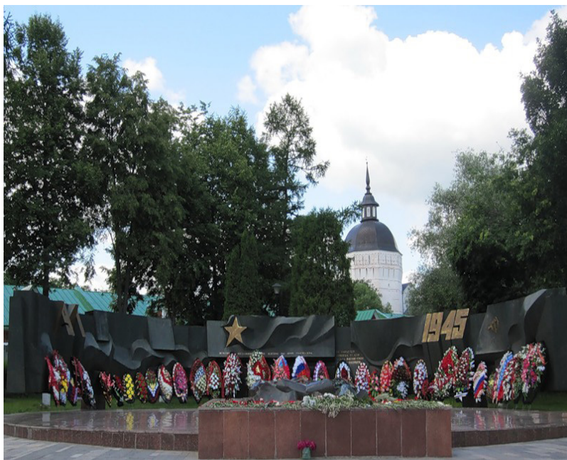
Рисунок 1. Мемориал воинской славы с Вечным огнем на братской могиле 259 бойцов, умерших от ран в госпиталях Загорска в годы Великой Отечественной войны (г. Сергиев Посад)

в Сергиево-Посадской гимназии зародился проект «Прифронтовой город Загорск» (в 1930–1991 годах город Сергиев Посад назывался Загорском).